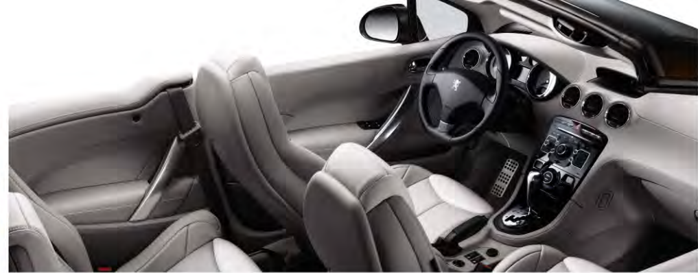
Vestidura en Piel Grège Lama (opcional)