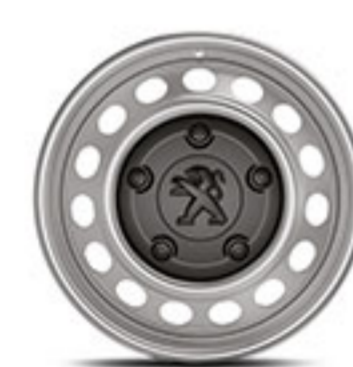
RINES DE ACERO DE 16"