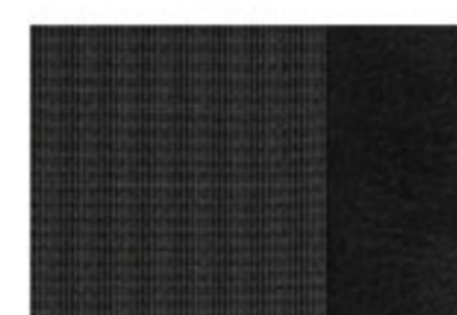
FURGÓN ASIENTOS EN TELA