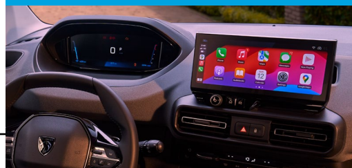
Nueva pantalla Táctil de 10" y Clúster Digital de 10"