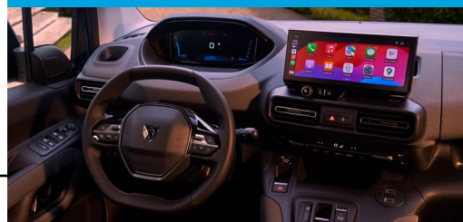
Nueva pantalla Táctil de 10" y Clúster Digital de 10"