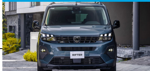
Eficiente motor gasolina con RENDIMIENTO DE HASTA 19.2 KM/L