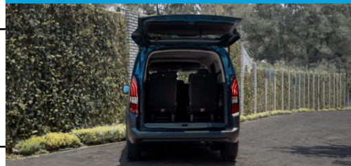
La más espaciosa del Segmento VOLUMEN DE HASTA 4,000L