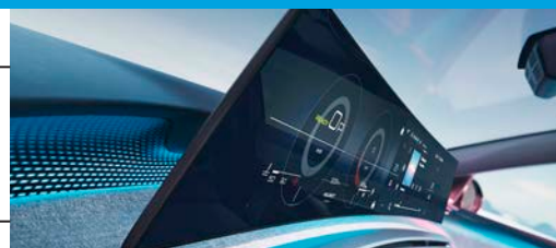
Pantalla panorámica curva de 21"