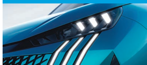
Faros con tecnología Píxel Led