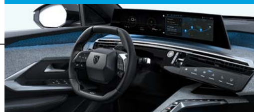
10 ayudas a la conducción de última generación (ADAS)