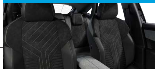
Asientos con masaje